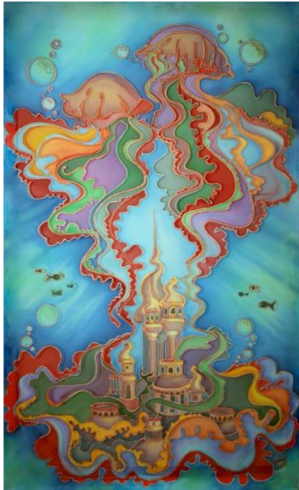
III місце – Юлія Бородіна (м. Щадринськ)